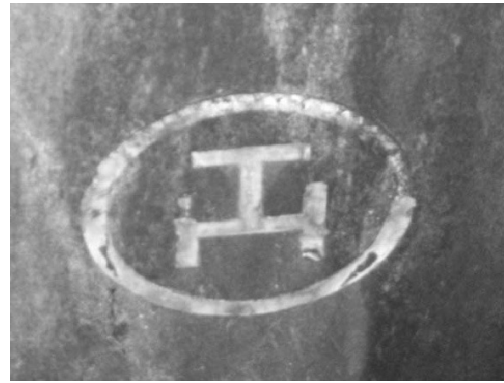
Figura 10. Triple Tau, Cementerio Británico.

1970). También se encuentran asociadas a los dos San Juan, patronos de la Masonería, y a los dos solsticios de invierno y de verano. El solsticio de verano corresponde al signo de Cáncer y es la “puerta de los hombres” que da acceso al pitr-yânâ de la tradición hindú, es decir, a la “vía de los antepasados”. Por otro lado, el solsticio de invierno corresponde al signo de Capricornio y es la “puerta de los dioses” que da acceso al deva-yâna , es decir, a la “vía de los dioses”. Esto también se vincula al simbolismo de Jano, que porta dos llaves que son las de las dos puertas solsticiales, ianua caeli y ianua inferni , correspondientes a los solsticios de invierno y verano. Sus llaves, además, eran una de oro y la otra de plata, correspondientes a los “Misterios Mayores” y los “Misterios Menores”, además de representar, respectivamente, el poder espiritual y el poder temporal (Guénon 1988). Por otra parte, las Columnas también pueden representar los tres pilares que sostienen a la Masonería, es decir, la Sabiduría, la Fuerza y la Belleza (Guénon 1970).