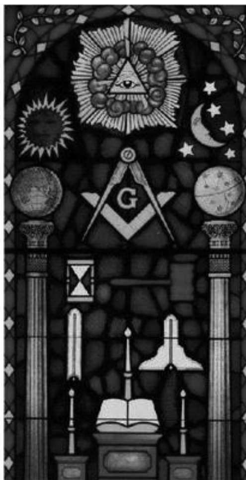
Figura 2. Símbolos masónicos.

Compás y Escuadra (Figura 3): La Escuadra es el instrumento para encuadrar nuestras acciones y el Compás para circunscribir nuestros deseos. La Escuadra, además, está