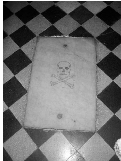
Figura 8. Pavimento de Mosaicos y Calavera y Tibias, Cementerio de Chacarita.

Calavera y Tibias (Figura 8): Son dos de los símbolos mortuorios que figuran en la Cámara de Reflexiones de las iniciaciones masónicas, junto al ataúd, el gallo, el reloj de arena y la guadaña, entre otros. En el grado de Maestro, representan los despojos mortales de Hiram Abbi y se asocian con otros símbolos del grado