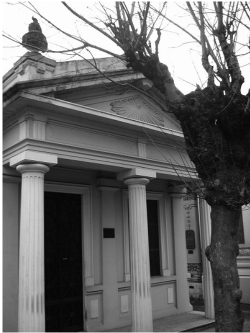
Figura 9. Columnas en panteón masónico, Cementerio de Chacarita.

1970). También se encuentran asociadas a los dos San Juan, patronos de la Masonería, y a los dos solsticios de invierno y de verano. El solsticio de verano corresponde al signo de Cáncer y es la “puerta de los hombres” que da acceso al pitr-yânâ de la tradición hindú, es decir, a la “vía de los antepasados”. Por otro lado, el solsticio de invierno corresponde al signo de Capricornio y es la “puerta de los dioses” que da acceso al deva-yâna , es decir, a la “vía de los dioses”. Esto también se vincula al simbolismo de Jano, que porta dos llaves que son las de las dos puertas solsticiales, ianua caeli y ianua inferni , correspondientes a los solsticios de invierno y verano. Sus llaves, además, eran una de oro y la otra de plata, correspondientes a los “Misterios Mayores” y los “Misterios Menores”, además de representar, respectivamente, el poder espiritual y el poder temporal (Guénon 1988). Por otra parte, las Columnas también pueden representar los tres pilares que sostienen a la Masonería, es decir, la Sabiduría, la Fuerza y la Belleza (Guénon 1970).