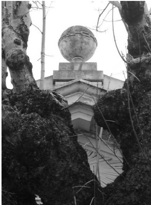
Figura 7. Cadena de Unión, Cementerio de Chacarita.

tales como la pala, el ataúd, el paño mortuario negro y la rama de acacia (Guénon 1970).