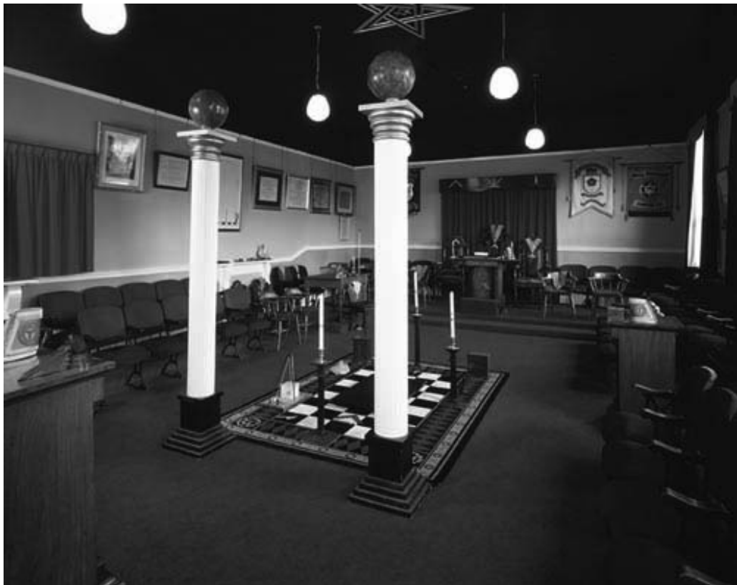
Figura 12. Logia masónica.

La Logia es un símbolo del Cosmos. Su forma es rectangular y simbólicamente, su largo se extiende de Oriente a Occidente, su ancho del norte al sur, su profundidad de la superficie al centro de la tierra, su alto de la superficie a la bóveda celeste y su cobertura es el cielo estrellado, encontrándose rodeada por la Cadena de Unión . En su centro se encuentra el Pavimento de Mosaicos , sobre el cual se levanta el Ara, el altar de la Logia. Encima de éste hay tres luces formando un triángulo equilátero, en medio del cual se encuentran las "Tres Grandes Luces" de la Masonería: el Volumen de la Ley Sagrada, el Compás y la Escuadra . En el centro de la Logia también puede observarse la Estrella Flamígera con la Letra G , mientras que en Occidente se hallan las Columnas "J" y "B" . Una Logia tiene tres Oficiales Principales: el Venerable Maestro, el