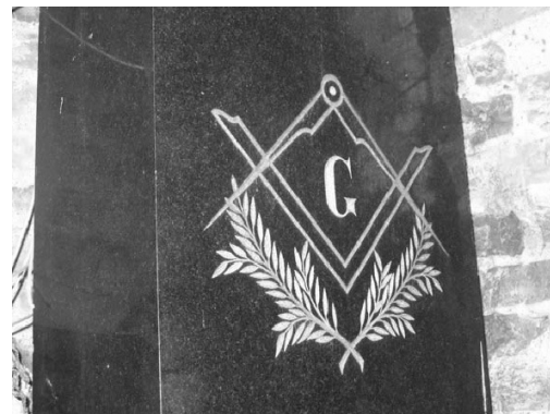
Figura 4. Letra G y Acacias, Cementerio Británico.

Acacias (Figura 4): La Rama de Acacia es uno de los símbolos del Grado de Maestro y simboliza la parte inmortal del hombre que nunca muere. Una rama de acacia fue plantada sobre la tumba del Gran Maestro Hiram Abbi, el Arquitecto del Templo del Rey Salomón, quien fue asesinado por tres malos Compañeros por no revelarles la Palabra Sagrada de los Maestros Masones (Guénon 1988). Debe observarse, respecto