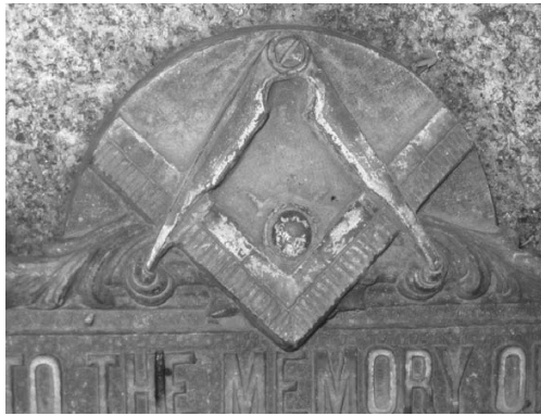
Figura 3. Compás y Escuadra (Grado de Maestro), Cementerio Británico.

asociada con la figura geométrica del cuadrado, el cual representa tradicionalmente a la Tierra, mientras que el Compás está asociado con el círculo, que representa el Cielo. La manera en que el Compás y la Escuadra están dispuestos entre sí en cada Grado es importante: en el de Aprendiz la Escuadra está por encima del Compás; en el de Compañero uno de los lados de la Escuadra está por debajo del Compás; y en el de Maestro el Compás es el que está por encima de la Escuadra. Esto representa que, al principio, las influencias celestes están dominadas por las influencias terrestres, para luego ir desprendiéndose de ellas gradualmente y finalmente dominarlas. El paso de la Escuadra al Compás, from square to arch , o de la Square Masonry a la Arch Masonry , representa el paso del estado humano, figurado por la Tierra, a los estados suprahumanos, figurados por el Cielo, es decir, un paso de los “Misterios Menores” a los “Misterios Mayores” (Guénon 1988). Este simbolismo del Cielo y la Tierra también se encuentra representado en las catedrales e iglesias cristianas, cuyos constructores les daban un carácter “pantacular”, en el sentido de hacer de ellas un compendio sintético del Universo. Dichas estructuras se encuentran formadas por una base de sección cuadrada (la Tierra) y coronadas por una cúpula o domo hemisférico (el Cielo), en cuya sumidad se halla la keystone (clave de bóveda), que es la piedra angular que representa el principio único del edificio y