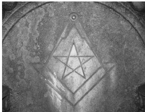
Figura 6. Estrella Flamígera, Cementerio Británico.