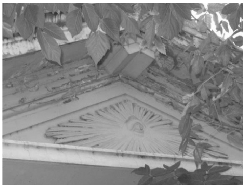
Figura 5. Delta, Cementerio de Chacarita.

Cadena de Unión (Figura 7): Rodea la parte superior de la Logia y está relacionada con el cordel que los masones operativos utilizaban para trazar y delimitar el contorno de un edificio, el cual se construía siempre según un modelo cósmico (Guénon 1988). Al ser la Logia una imagen del cosmos, la Cadena de Unión se convierte en un símbolo del “marco” del cosmos. Los nudos que posee de trecho en trecho, habitualmente doce, representan a los